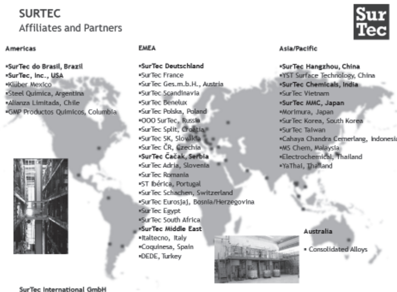
図1 サーテック社グローバルネットワーク

サーテック社はお客様のご要望に沿った独自の製品作りをモットーとしており、洗浄性能が高く、長寿命で環境に配慮された製品を提供している。素材・油の種類、素材へのアタック度に応じて最適な